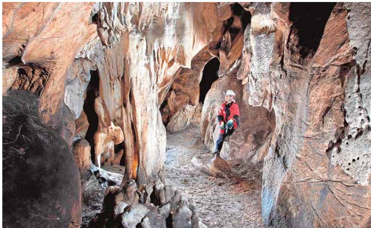
En el interior de Los Covachos se registran hasta 286 signos grabados y pinturas esquemáticas