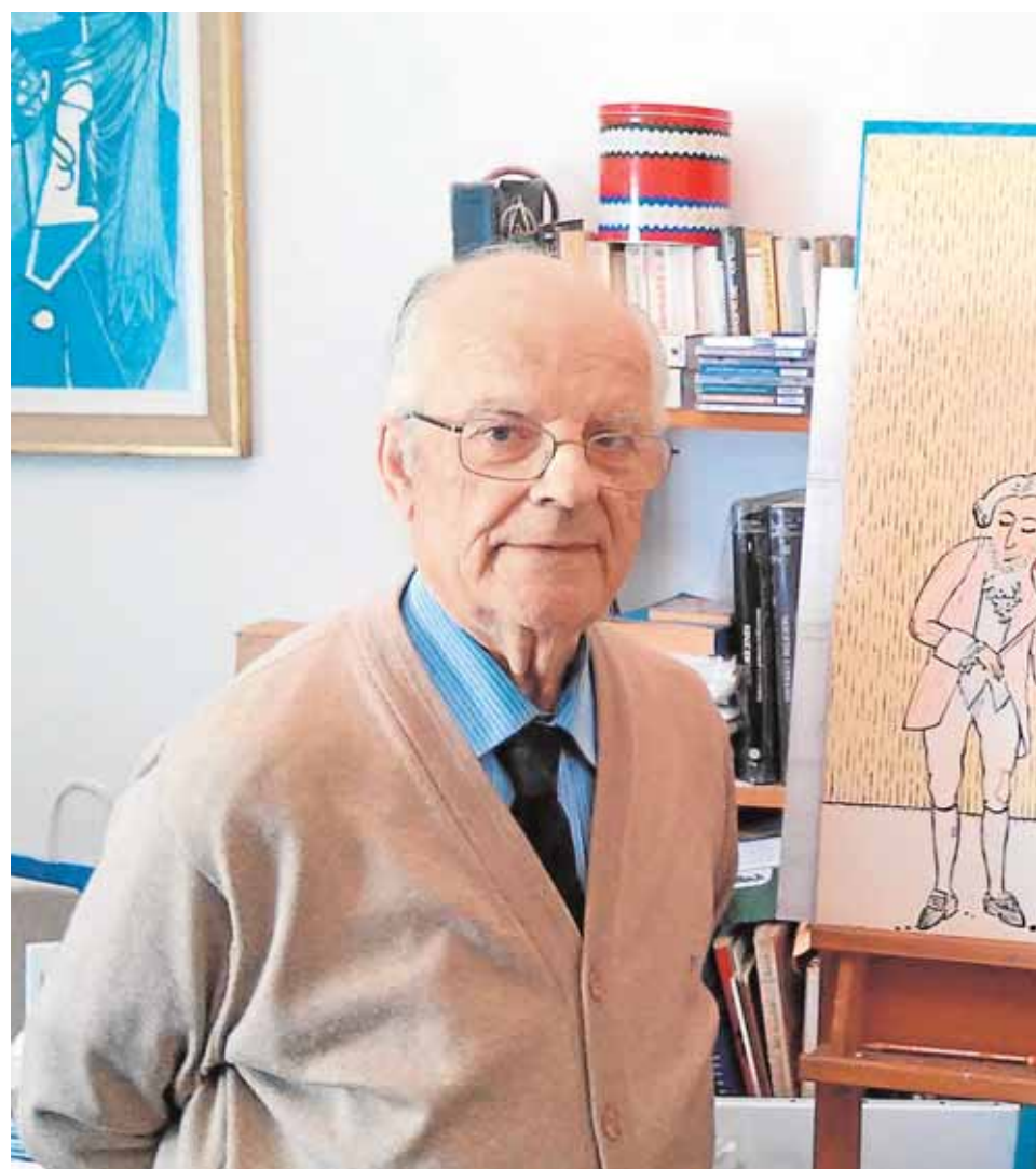
El pintor muestra en su taller uno de los trabajos que realizó en su periodo como docente.

Retrospectiva a su obra El Museo de Osuna inaugura el 10 de mayo una exposición con algunas de sus pinturas de estilo naíf