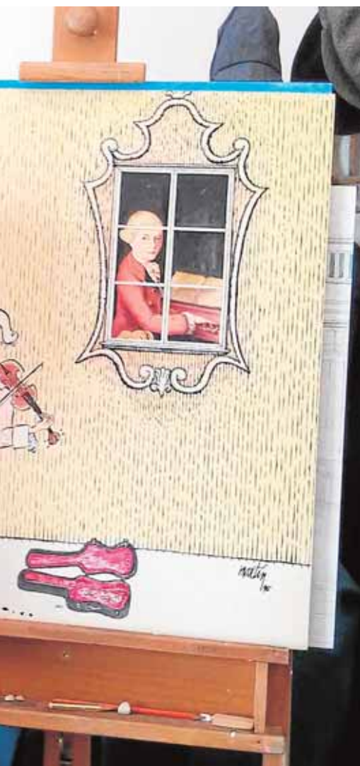
ibujante de viñetas

nos que han participado en el programa Experiencias Creativas de la Diputación Provincial de Sevilla. Las pinturas con la particular visión de los jóvenes artistas se podrán visitar en la Casa de la Cultura situada en la Plaza de Andalucía. B.M.