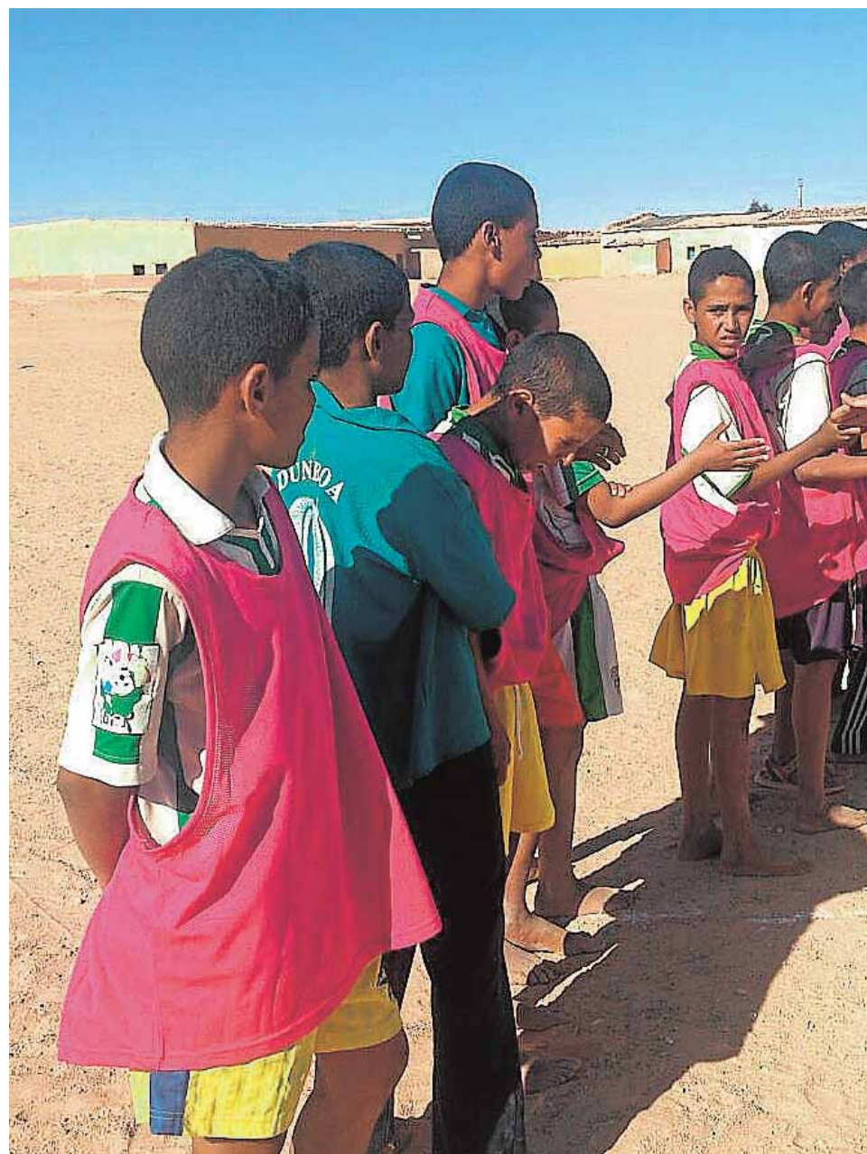
Un grupo de niños que participaron en un campeonato de fútbol

Se trata de formar a las personas responsables de los dispensarios de salud de los campamentos en los conocimientos sanitarios y técnicos que les permitan asistir adecuadamente a las refugiadas en los nacimientos. Pero también de que esta formación les permita en el futuro seguir enseñando a nuevas personas en la región. Para ello se requiere un periodo de formación de unos dos años que deberán acometer enfermeras de España. El planteamiento es que sean voluntarias, que se vayan turnando de forma que permanezcan allí un mes en turnos de dos personas. En este proyecto también se ha implicado la Diputación Provincial. Ya cuentan con los fondos necesarios para el material de formación y aho-