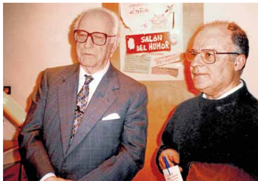
Junto a Antonio Mingote en el II Salón del humor, en el que participó.