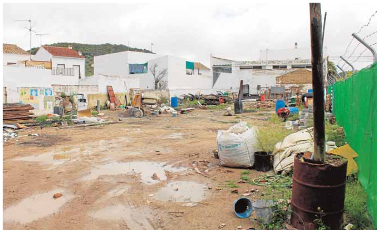
El solar donde tendría que estar edificada la residencia de ancianos

Recortes en salud Sólo hay una ambulancia para todo el pueblo, que tiene que conducir un policía local