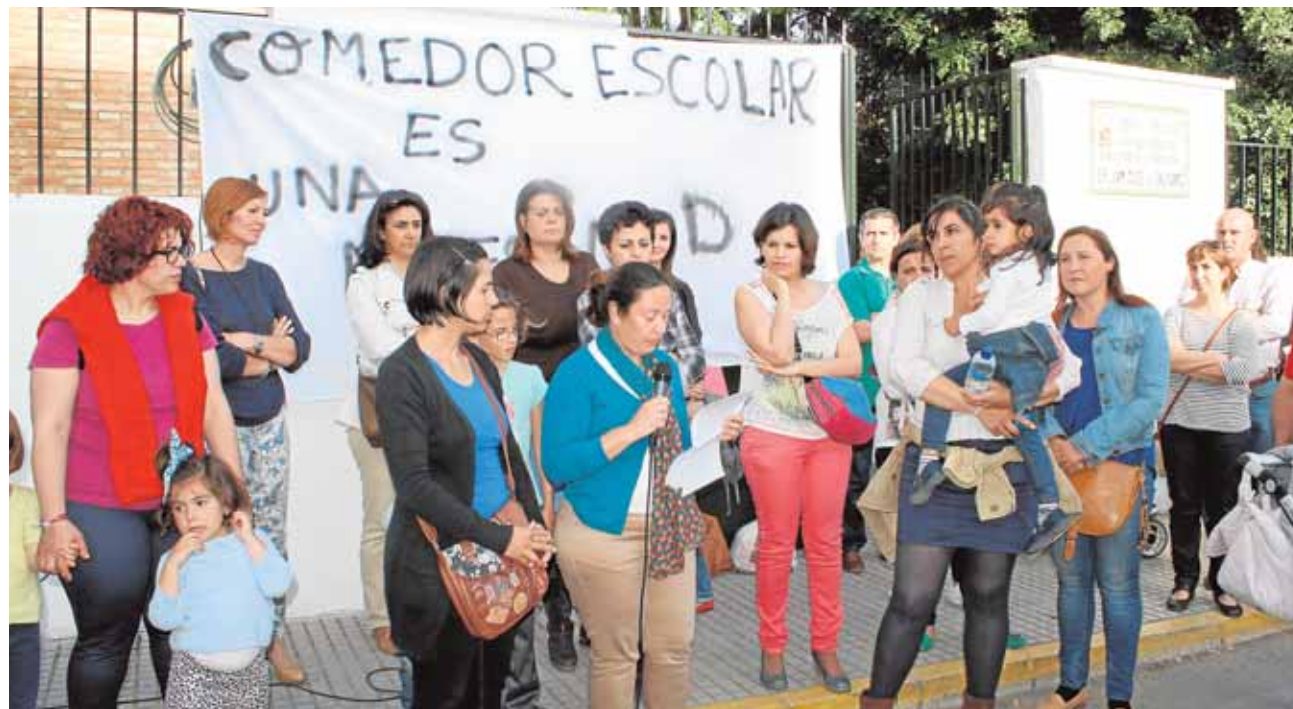
Padres y alumnos concentrados frente a las puertas del colegio reclamando el comedor escolar