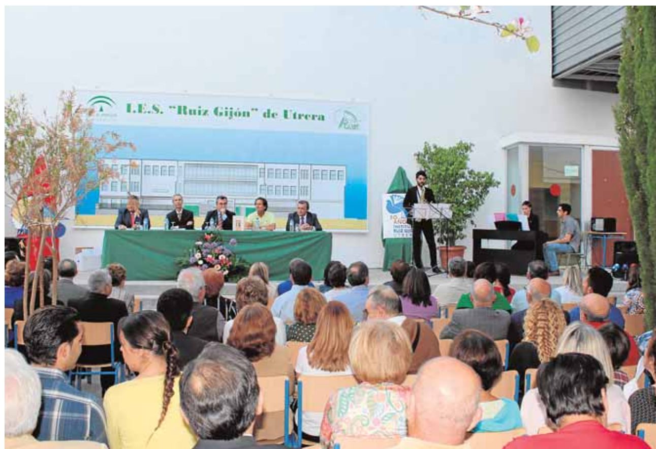
Conmemoración de las bodas de plata del Ruiz Gijón, el primer instituto de Utrera

Las cruces de mayo de Lebrija 2015 tendrán lugar los días 1 y 2, y 8 y 9 de mayo, distribuyéndose por calles y plazas de la ciudad, generalmente cerca de una hornacina con una cruz.