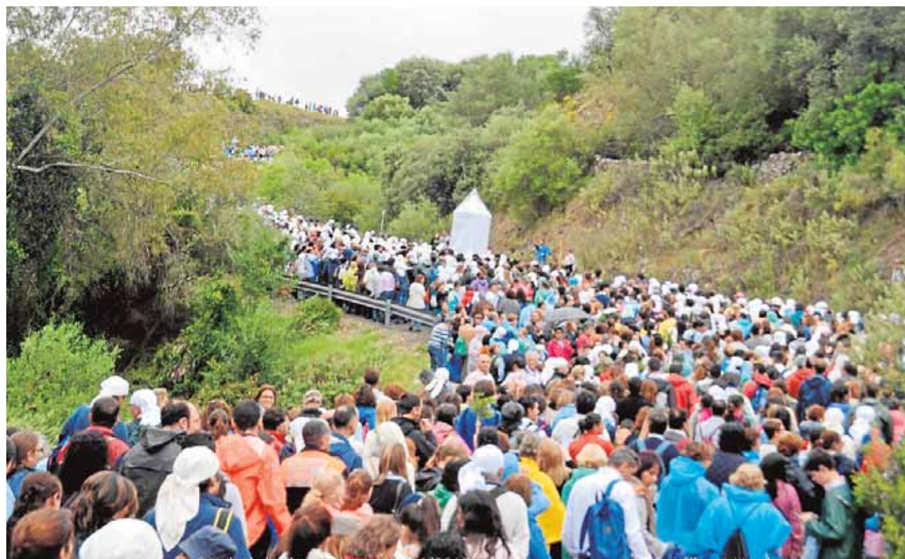
Multitud de fieles loreños llevan a su Patrona a Lora del Río a través de caminos y arroyos