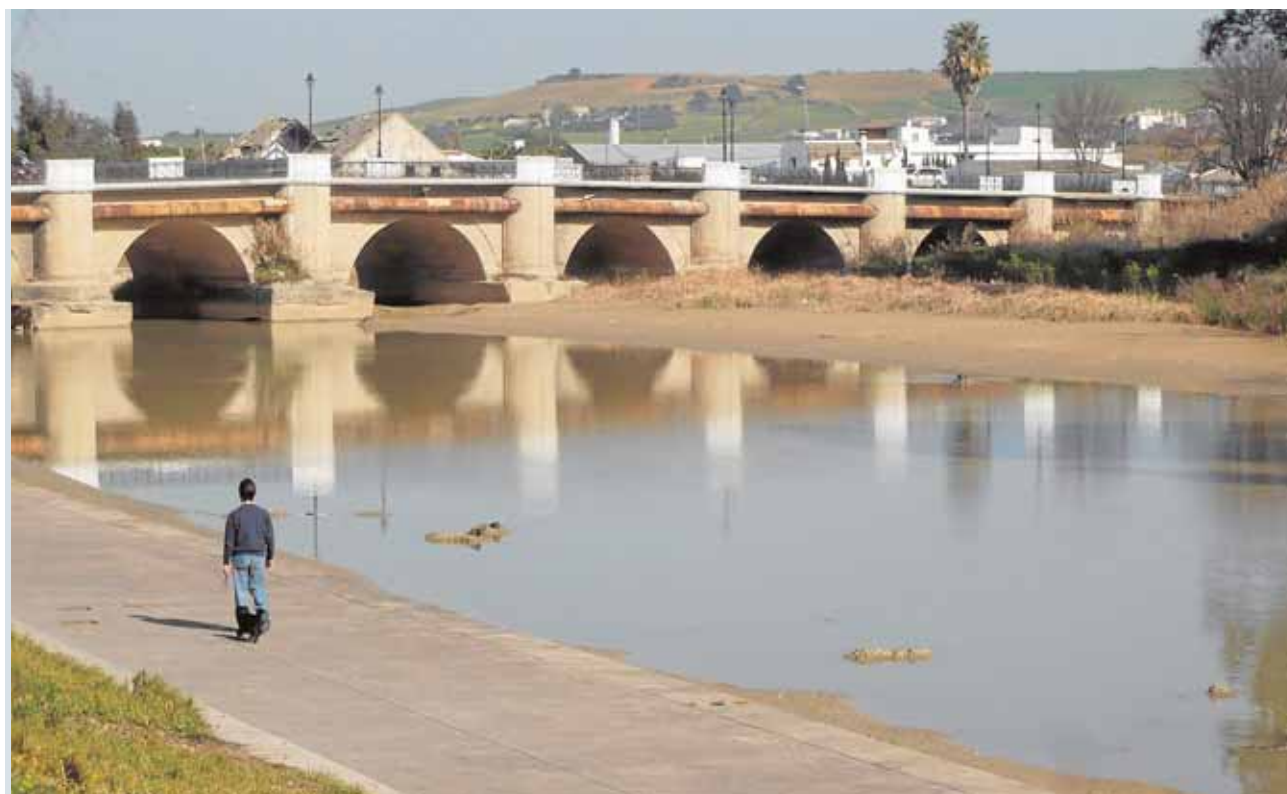
El nuevo Plan transformará el área del embarcadero en el Parque San Pablo, muy deteriorada

La existencia de una compleja y extensa red de vías pecuarias en Andalucía -rutas por dónde ha venido discurriendo el tránsito ganadero-, implica la necesidad de regular su protección de forma que se compatibilice su uso con el desarrollo socioeconómico y la conservación del patrimonio.