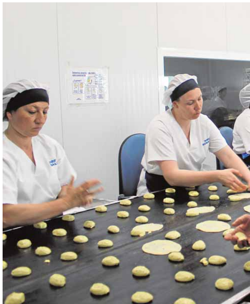
Trabajadoras de la empresa, encargadas de dar forma a las tortas, a partir de la ma

Flexibilidad y versatilidad «Escuchamos al mercado para poder adaptar nuestro producto a sus necesidades», dice su presidente